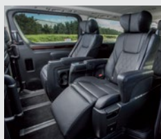
Segunda fila de asientos con regulación eléctrica y calefaccionados