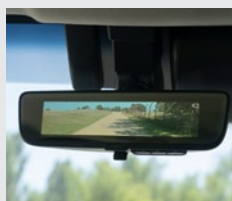
Espejo retrovisor con visión trasera digital