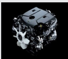
Motor 1GD (2.8l) - 163 CV

*Diésel con contenido de azufre menor a 10 ppm. **Toyota Safety Sense, integra diferentes sistemas de seguridad activa que pueden variar según cada modelo y/o versión. A su vez, estos sistemas están diseñados para asistir al conductor, no para sustituirlo. El conductor debe mantener en todo momento el control de su vehículo y es responsable de su conducción, por cuanto estos sistemas no reemplazan la conducción segura. El correcto funcionamiento del Toyota Safety Sense y de los distintos tipos de sistemas que equipan, depende de muchos factores incluyendo las condiciones del camino, el clima y el vehículo, razón por la cual el/los sistemas podrán verse afectados u obstaculizados debido a factores externos, no siendo Toyota Argentina S.A. responsable de las consecuencias derivadas del uso del sistema. Para más información sobre Toyota Safety Sense, dirigirse a la web toyota.com.ar o consulte el manual de usuario. ***Disponible solo por conexión USB. Verifique la compatibilidad de tu modelo con el fabricante.