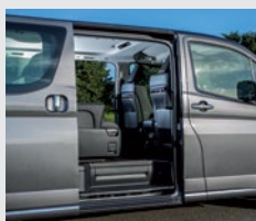
Puertas traseras laterales con apertura eléctrica