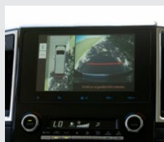
Cámara de retroceso con sistema de visión 360° en pantalla de audio